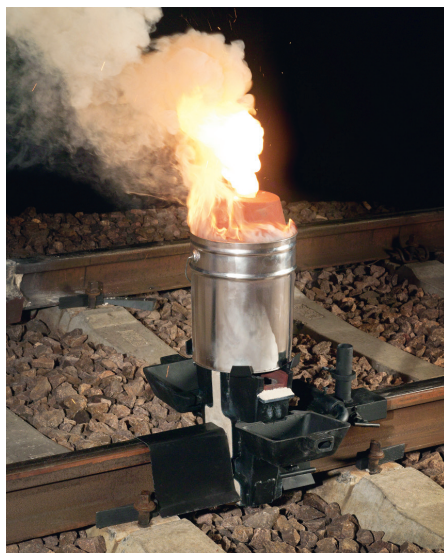
Abb. 1: Thermit-Prozess