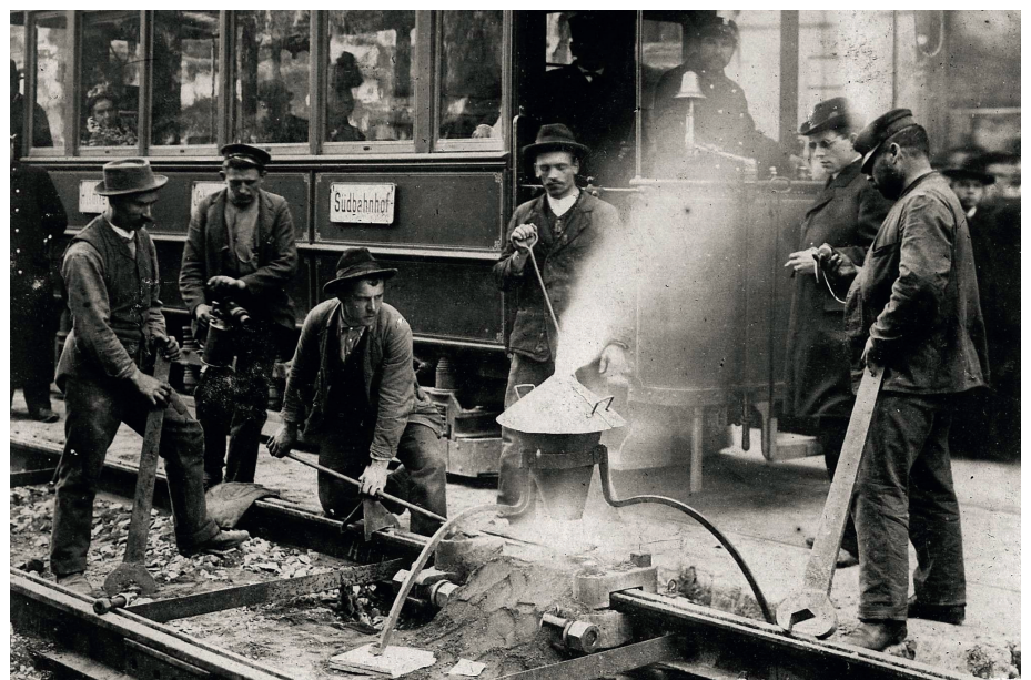
Abb. 3: Thermo-Schweißen von Rillenschienen in Graz vor 1914

Historisch gewachsen haben sich bei Bahnen und Bahnbehörden individuelle Zuständigkeiten, Prozesse und Anforderungen für die Zulassung von Thermo-Schweißverfahren, aber auch für die Qualifizierung und Zertifizierung von Thermo-Schweißern und ausführenden