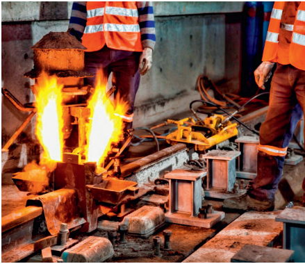
Abb. 6: Schlusschweißung im Marmaray-Tunnel