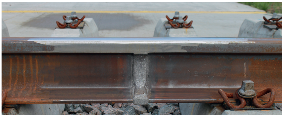
Abb. 4: Feingeschliffene Thermit-Schweißung

Es gibt zahlreiche Einflussfaktoren, die die Lebensdauer einer Thermit-Schweißung be-