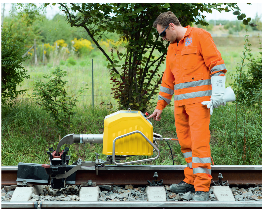
Abb. 5: Automatisierte Vorwärmung mit Smartweld Jet

Bisher bekannte Optimierungsmethoden des Thermit-Stahls, wie Möglichkeiten zur Kornfeinerung oder Nutzungen von bekannten Legierungskonzepten (Kohlenstoff, Mangan, Chrom, Vanadium ...) sowie Schweißprozessvarianten, die beim Einguss nur den Schienenkopf aufliegen, geraten jedoch schnell an ihre Grenzen. In einem aufwendigen Entwicklungsprojekt ist es jedoch gelungen, ein innovatives Legierungskonzept, das in einem engen, aber ausreichenden Arbeitsbereich funktioniert, zu erarbeiten. Der so optimierte Thermit-Stahl besitzt deutlich verbesserte statische und dynamische Eigenschaften, wie Laboruntersuchungen bewiesen haben. Inzwischen ist dieses Legierungskonzept für zahlreiche Anwendungen nach relevanten Normen zugelassen und überzeugt bei der Anwendung. Es wird unter dem Namen Thermit Plus vermarktet.